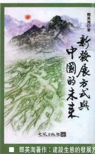
鄧英淘著作：建設生態的發展方式躍遷